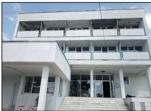
Новата фасада на Трансграничния център за съвместен мониторинг за опазване на околната среда в страните от Черноморския басейн