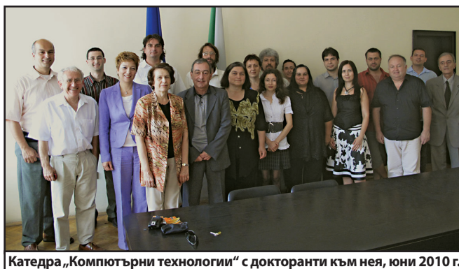
Катедра „Компютърни технологии“ с докторанти към нея, юни 2010 г.