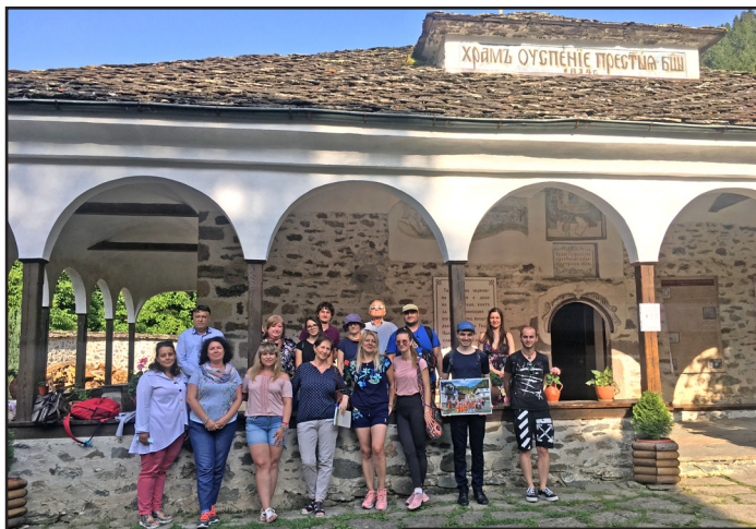
Пред църквата „Успение Богородично“ в Широка лъка