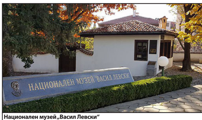
Национален музей „Васил Левски“

Студентите, участвали в този проект, представят визията си за обществени организации, дружества, асоциации и групи по интереси, които биха могли реално да се заемат със задачата за ценностно поддръждане на българското общество, следвайки най-висшия ценностен кодекс, а именно – словото на Левски.