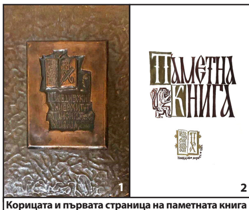
Корицата и първата страница на паметната книга

Следват изброени на две страници петнадесет от присъствалите