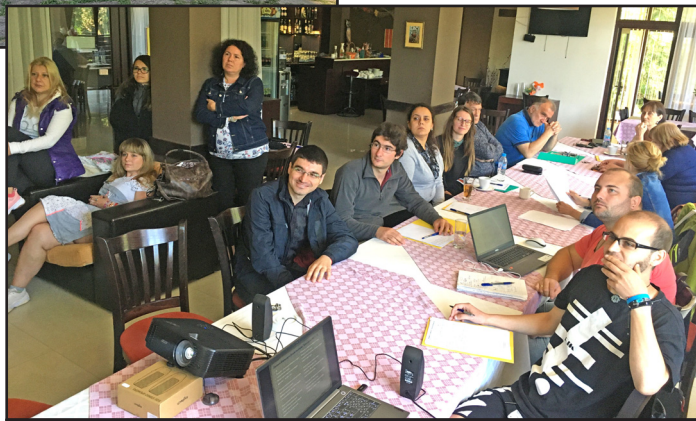
Работен момент от семинара

британия. Нейният заключителен доклад „Бележки върху употребата на Средновековието в съвременната култура: Изток – Запад“ представи обзорна обобщена картина върху функционирането на Средновековието в по-съвременен контекст. В самия край на конференцията докторантите представиха накратко научните си търсения. Значителна част от участващите докторанти бяха медиевисти, но дори и за онези, занимаващи се с проблематика, чужда на Средновековието, изнесените доклади бяха полезни – дадоха множество импулси за размисъл, за научно и духовно израстване.