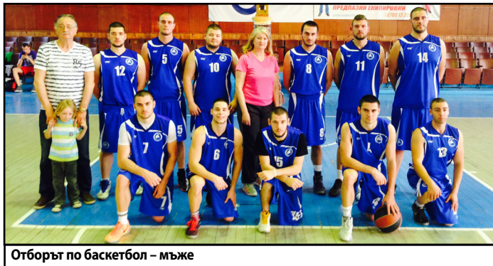
Отборът по баскетбол – мъже