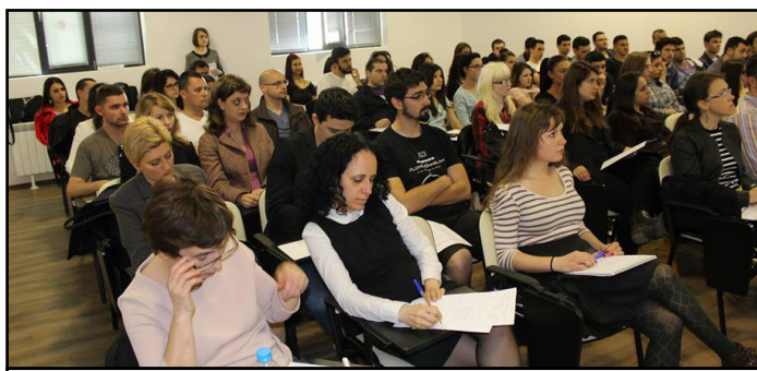
Работен момент от семинара на тема „Запрещението – лабиринт без изход“

Дни преди 16 април – Ден на българтската конституция и празник на юристите, Юридическият факултет на Пловдивския университет „Паисий Хилендарски“ стана домакин на редица семинари, конференции и симпозиуми. Студентите от правната клиника „Адвокатска защита на лица с психически заболявания“ в партньорство с ELSA – Пловдив, Студентския съвет и Българския център за нестопанско право проведоха семинар на тема „Запрещението – лабиринт без изход“. В проявата участваха над 60 студенти и академични преподаватели. Студентите от правната клиника обясниха същността на института на запрещението, а първокурсниците по право активно се включиха в дискусията и „репетираха“ аргументите си „за“ или „против“ отпадането на тази мярка, която ограничава правата на човека. Разгледан беше и член 12 от Конвенцията за правата на