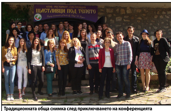
Традиционната обща снимка след приключването на конференцията

„Научният форум е една прекрасна възможност и предизвикателство за нас, дава ни шанс да избягаме от рутината и да се потопим изцяло в света на науката, където времето не тече по същия начин – превръщаме се в част от безкрайността“ – коментира носителката на първа