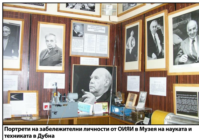
Портрети на забележителни личности от ОИЯИ в Музея на науката и техниката в Дубна

„...Роден съм и живея в един от най-старите и хубави градове на Европа, известен със своите тепета и разположен около най-голямата българска река Марица – град Пловдив. Моят град има осемдесетвековна история и висока съвременна култура, заради което е избран за европейска столица на културата през 2019 г. Обичам моя роден град, защото той ми даде началните знания, възпита ме в уважение към трудовите хора и на любов към красотите на природата. Това не ми попречи да обикна и тебе, Дубна, твоята сурова природа, твоите приветливи граждани и най-вече твоето „сърце“ – Обединения институт за ядрени изследвания, чийто пулс усеща цялата световна наука“ (в-к „Дубна“, 15 януари 2016 г.).