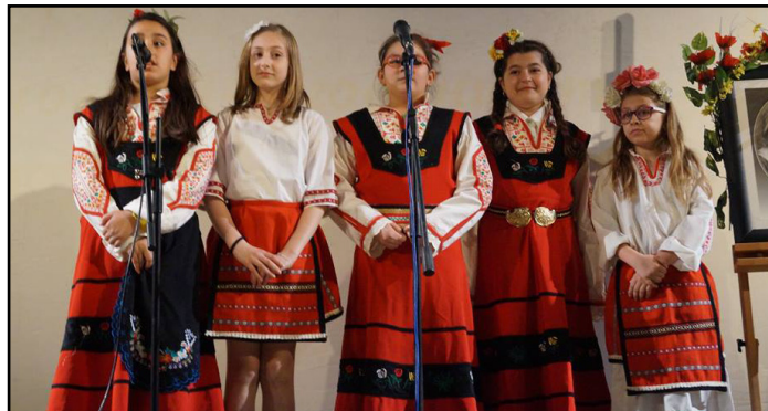
Участници в конкурса