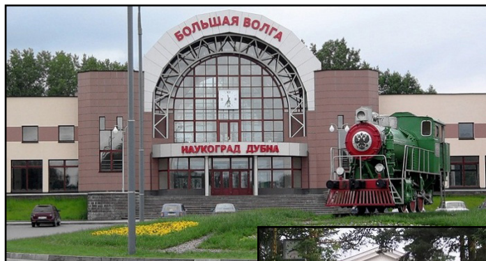
Гарата на Дубна (горе) и Главният административен център на ОИЯИ

Значителни успехи ОИЯИ бележи в теорията и експери-