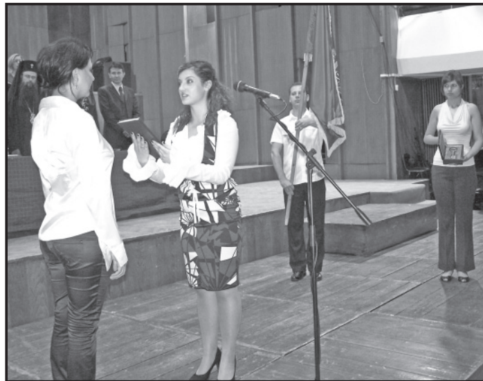
Абсолвенти предават на първокурсниците символите на университета