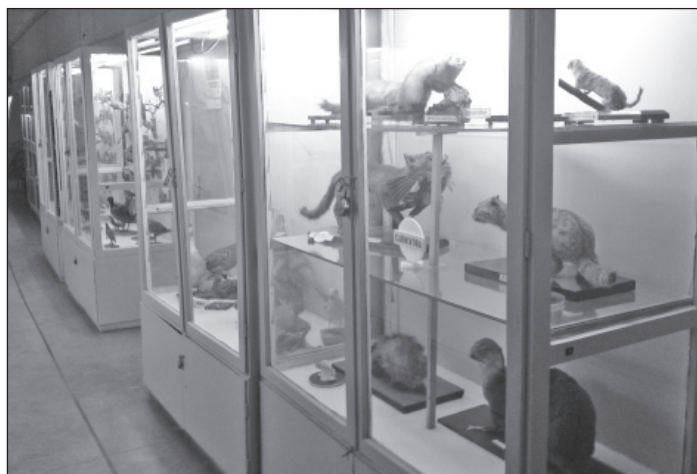
Поглед към една от сбирките на тепето, която многобройните гости имаха възможност да разгледат

1. Анализ на представянето на участието на студентите от ПУ „Паисий Хилендарски“ в стажантските практики на територията на организациите партньори. Анализите бяха аргументирани с данни за представянето на знанията на студентите на входно и