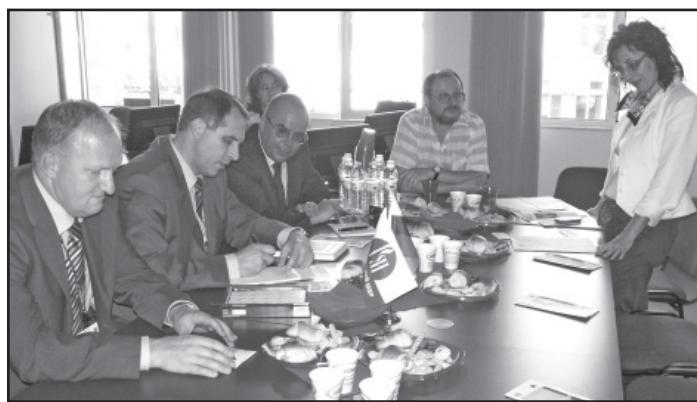
Срещата в Руския център

Гостите бяха запознати с историята на университета, Филологическия факултет и Катедрата по руска филология, с ресурсите и възможностите за различни инициативи и дейности, които предлага новооткритият Център за руски език и култура. Подчертано бе специалното място, което е заемало в продължение на десетилетия обучението по руски език и култура в университета. Обсъ-