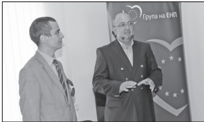
Заместник-министърът на културата Тодор Чобанов и евродепутатът Емил Стоянов

„За мен е изключително важно, качествено и бързо да представим нашия град и околностите му. Мисля, че Пловдив ще има най-доброто регионално представяне в „Европеана“, заяви евродепутатът Стоянов. Според него, част от скептичното отношение към България идва от непознаването на страната ни. За да илюстрира важноста на представянето на града ни в проекта, Емил Стоянов показа белгийска карта на европейския континент от