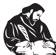
ПУ „Паисий Хилендарски“