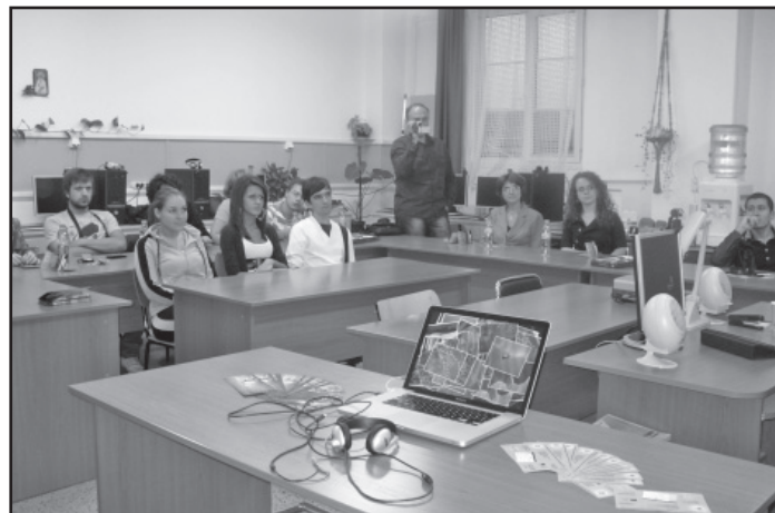
Момент от презентациите

Гидът е разработен на български и английски език. Предстои разработване и на немски език, както и за други български