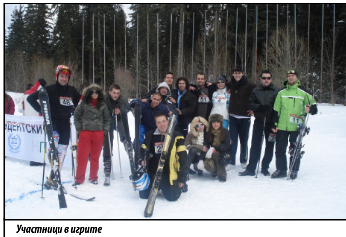
Участници в игрите

изключително желание, въпреки липсата на опит и умения. На първо място в Националните зимни студентски игри се класира отборът на НСА, втори бяха колегите ни от Медицински университет – Пловдив, а почетното трето място зае отборът на Медицински университет – София. Отборът на ПУ се представи достойно и се класира на 8-мо място. Първите зимни студентски игри бяха едно доказателство, че няма невъзможни неща – студенти от цяла България се обединиха в името на спорта. Състезанието се проведе в духа на честната игра и олимпийския принцип – важно бе участието. Игрите бяха открити и закрити с факелно спускане на колегите от националния демо тим на България по ски, в който влизат студенти от НСА.