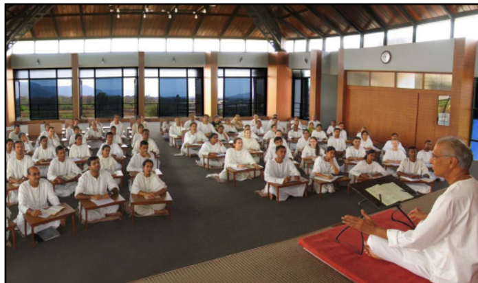
Ученикът сядва близо до учителя с нужния респект в очакване да чуе древното слово – това означава и думата „упанишада“, тази част от Ведите, които са същността на източната философия

тическият индиец показва един друг тип грамотност – духовната, резултат от културната традиция. Може да не е завършил училище, но да е способен да води разговор за древната философия, да има впечатляващи знания за духовната природа на човека, каквито много образовани „западнци“ нямат. Всяко индийче е откърмено с историите от „Махабхарата“ и „Рамаяна“, където има толкова много философия и знания