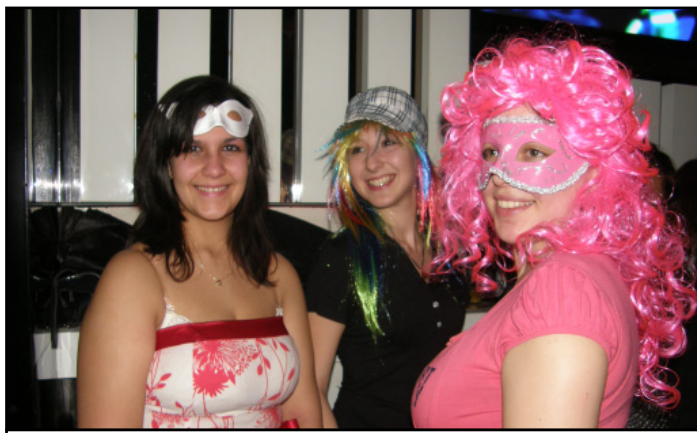
Три атрактивни участнички в бала с маски

университет и беше посетен от над 1200 студенти. В заведението се влизаше със специални покани, които се раздаваха предните дни в Университета. Всички студенти в духа на събитието носеха колоритни маски и костюми. Всеки от тях се беше превъплътил в различна роля – фея, ангелче, принцеса, вещица, рицар, каубой, пират, лекар, шейх или герой от филми. Студентите се забавляваха заедно, а организаторите се бяха погрижили за най-активните да има и множество награди.