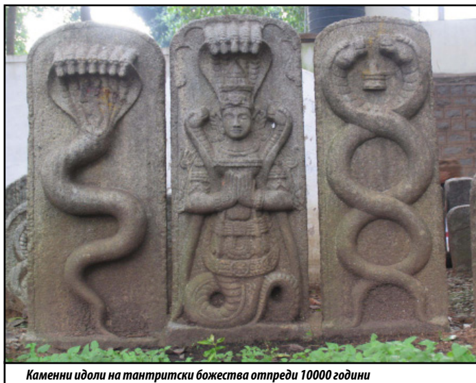
Камени идоли на тантрически божества от преди 10000 години

бизнеса. Търси се създаване на глобално мислещия мениджър, с холистичен подход към работата си и света. („Бизнесуик“, Октомври, 2006).