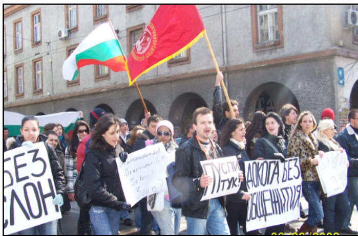
Студентските протести се увенчаха с успех

Протестният палатков лагер, който студентите от ПУ готвеха пред Нова сграда, бе отменен! Десетки палат-