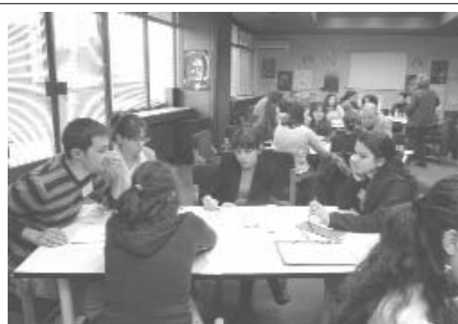
Участниците в семинара