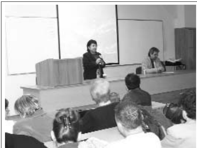
Момент от вечерта на руския шансон

други, чието характерно изпълнение – като уникални текстове и музика, развълнува феновете и бъдещите почитатели на руската душевност и култура. "Душа с душа се сля", както определя въздействието на руския шансон поетът Евг. Евтушенко. Ако регламентът на времето не бе така ограничен,