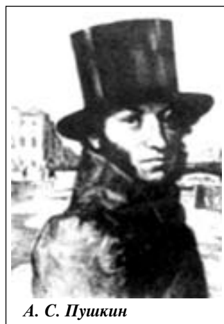
А. С. Пушкин