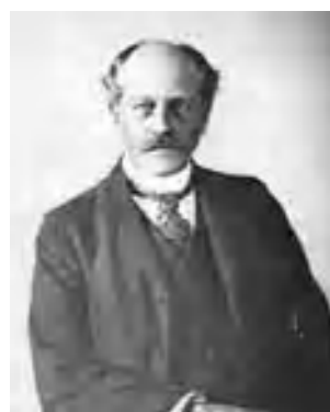
Астрономът П. Лоуъл предсказва теоретично съществуването на Плутон

Клайд Томбо с нескрито вълнение прочита писмо, получено от Националната аеро-космическа агенция на САЩ, което се оказва по-значимо от всички дотогавашни научни награди. Със задания в него въпрос не можело да се обърнат към никого друго в света. НАСА питала за разрешение да бъде посетен Плутон – планетата, открита от Томбо. Писмото било израз на уважение към известния астроном. Поддържайки задания от НАСА тон, Томбо дава своето съгласие, след което започва проектирането на полет на автоматична станция до най-далечната планета в Слънчевата