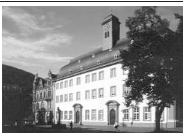
Старата сграда на Хайделбергския университет

Към тази група се отнасят също техническите университети ( Technische Universitaeten ) и приравнените към техния статут висши технически училища ( Technische Hochschulen ) в Аахен и Дармщадт. Границата между техническите университети и университетите често е условна: