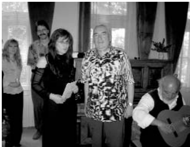
Момент от премиерата