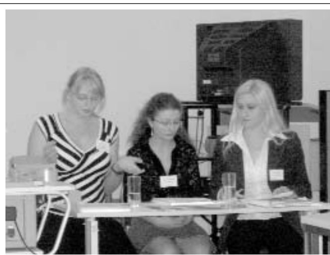
Работен момент от конференцията

В конференцията, на която за първи път бяха поканени и студенти, взех-