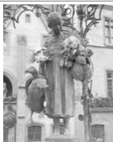
Статуята на малката гьсарка - най-целуваното момиче в света

факултета по теология, право, медицина и философия се прибавят нови девет. Днес Гьотингенският университет има 13 факултета, които предлагат повече от 130 специалности и програми, около 24 хиляди студенти и 2500 преподаватели. Съвременният облик на този академичен център е резултат от богатите традиции на международно признатото качество на обучение, тясно обвързано с водещите научни изследвания и получаваните резултати. Предизвикателствата на настоящето и бъдещето се