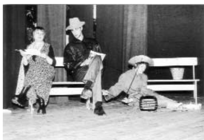
Момент от спектакъла „Разходка в парка“

Класът на проф. Надежда Сейкова и доц. Виолета Гиндева (II курс) игра „Разговор в парка“ на Алън Екбърн и фолклорния спектакъл „Ха да видим кой кого“. Представлението „Ах тези български нрави“ беше колаж от текстове на български автори от различни поколения, интерпретирани по съвременен начин. Представлението имаше успех и на две от откритите сцени в Пловдив - беше прието много емоционално от