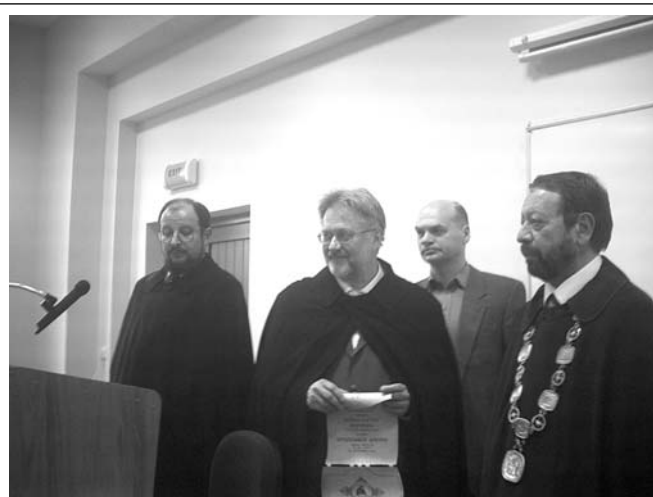
Момент от тържествената церемония

Йосип-Растко Мочник, професор по социология на културата в Люблянския университет, през 2004 г. навърши 60 години. Той е автор на над 250 публикации на 13 езика по социология на културата, социология на литературата, философия на езика, теория на дискурса, семиотика, теоретична антропология, теоретична психоанализа и политическа теория. Сред тях се открояват книгите му „Изследвания по социология на литературата“ (1983), „От дума на дума: изследвания върху философията на обикновения език и механизмите на идеологията,“ (1985), двата тома с есета „Extravagantia“ (1994-1995), „Три теории - идеология, нация, институция,“ (1999), „Засрещания: истории, преходи, вярвания“ (на български език; 2001) и „Теория за политиката“ (2003). Чел е лекции и курсове в 17 университета в све-