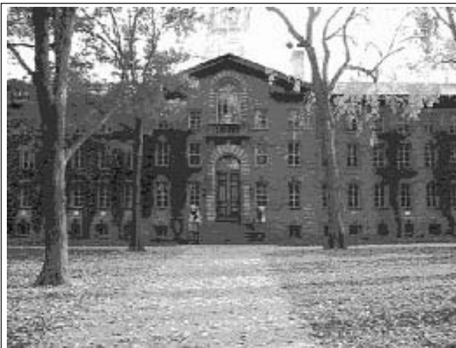
Университетът в Принстън

Принстън ( www.princeton.edu ) е създаден през 1746 г.