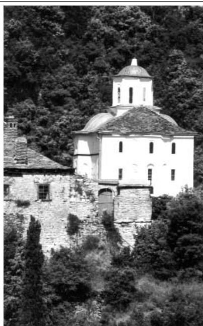
Църквата „Св. Георги“ с първото килийно училище в Зографския манастир

На сутринта рано отскочихме до пещерата на свети Атанасий - основателят на Великата Лавра, привлякъл със святостта си много подвижници и щедростта на византийските императори. Гледката при изгрев слънце, която се разкриваше, беше неописуема. Тук сякаш природата сама насочва човека към съзерцателност и богословско размишление.