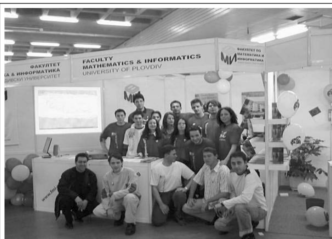
Студентите, участвали в подготовката и презентацията на експозицията на Факултета по математика и информатика

поставимост и привлекателност в европейската зона на висше образование. Идеите, формирани в Болоня и Саламанка, бяха доразвити на срещата на европейските образователни министри в Прага през 2001 г. Там бяха изведени три важни насоки на бъдещите съвместни усилия: