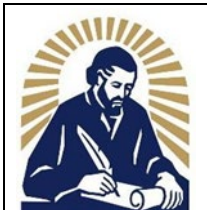
ТАБЛИЦА за определяне на рисковете в дейността на ..... към ПУ „Паисий Хилендарски“