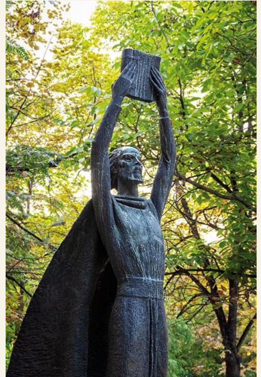
ПУ „Паисий Хилендарски“