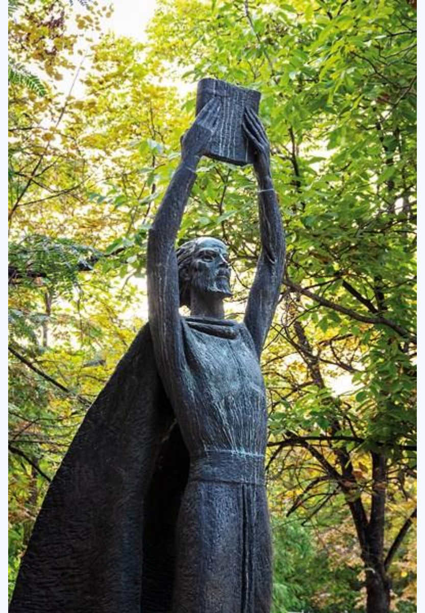
ПУ „Паисий Хилендарски“

Висококачествено практически ориентирано обучение, иновативни научни изследвания и трансфер на технологии за реализиране потенциала на Университета в национален и международен мащаб.