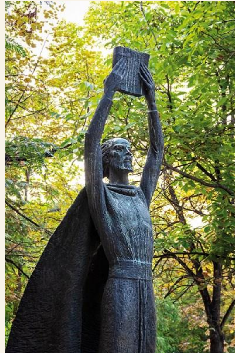
ПУ „Паисий Хилендарски“