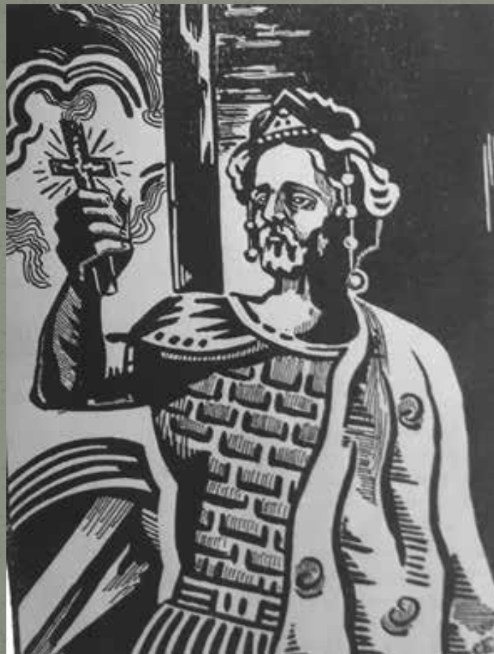
Илюстрация С. Пенчев: Косара и Мирослава и Св. Йоан Владимир с дървения кръст (Попова-Мутафова 1929: 9, 27)