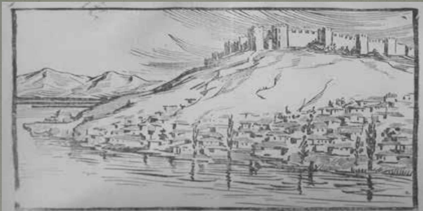
Илюстрация Пенчо Георгиев: Охрид (Паспалеев 1927: 2)